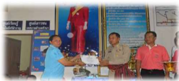
ภาพที่ 1 การมอบใบเกียรติคุณให้กับผู้บำเพ็ญตนทำความดีอย่างสม่ำเสมอในชุมชนและสังคม

จุดประสงค์เพื่อให้ชาวบ้านได้มีจิตสำนึกมองเห็นคุณค่าของการร่วมทำกิจกรรมต่างๆ ในหมู่บ้านที่ก่อให้เกิดประโยชน์ในชุมชน ชุมชนน่าอยู่ห่างไกลยาเสพติดมีความเข้มแข็งและยั่งยืน