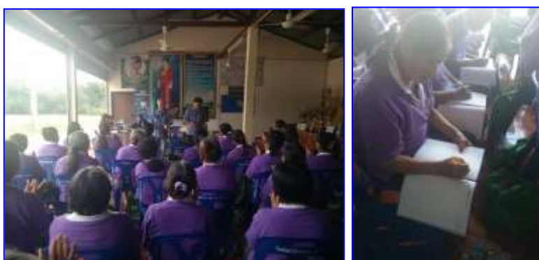
ภาพที่ 26 - 27 การ

สำนักงานเกษตรจังหวัดหนองบัวลำภู ร่วมกับสำนักงานตรวจบัญชีสหกรณ์ จัดกระบวนการเรียนรู้ เรื่องการจดบันทึกรายรับ รายจ่ายในครัวเรือน การจัดทำบัญชีครัวเรือนเบื้องต้น เพื่อให้เห็นความสำคัญและการนำไปใช้ประโยชน์ในเรื่องการออม และการจดบันทึก