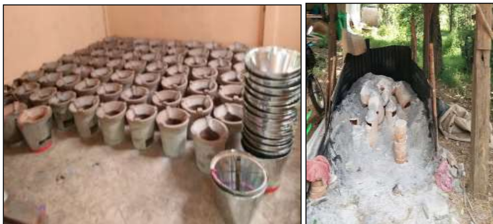
ภาพที่ 6 -7 กระบวนการผลิตเตาอั้งโล่