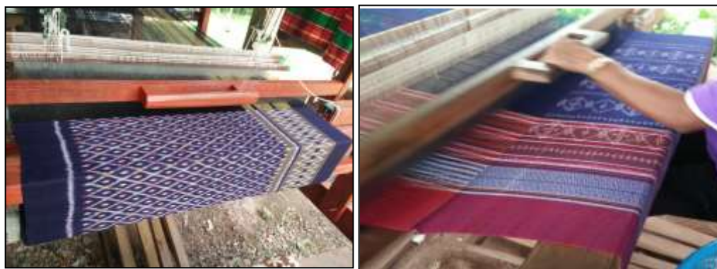
ภาพที่ 10 -11 ลักษณะลายผ้า