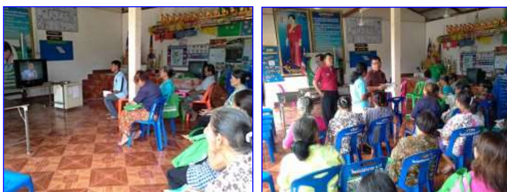
ภาพที่ 24 - 25 การจัดกระบวนการเรียนรู้ของสมาชิกในโครงการฯ

นักวิชาการส่งเสริมการเกษตร สำนักงานเกษตรอำเภอเมืองหนองบัวลำภู ร่วมกับสำนักงานเกษตรจังหวัดหนองบัวลำภู และหน่วยงานภาคี เป็นผู้จัดกระบวนการเรียนรู้ โดยมีมติในการเรียนรู้ร่วมกันทุกวันพุธของสัปดาห์ ตั้งแต่เวลา 09.00 น. - 12.00 น.