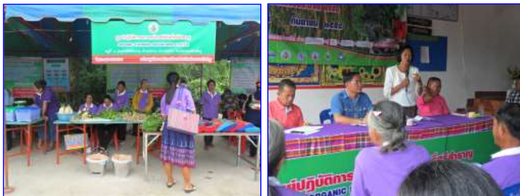
ภาพที่ 28 - 29 การอบรมการผลิตพืชแบบ

ของจังหวัดหนองบัวลำภู ในการปฏิญาณตน ลด ละ เลิก การใช้สารเคมีการผลิตพืช เพื่อความปลอดภัยของผู้ผลิตและผู้บริโภค และเพื่อความยั่งยืนในการประกอบอาชีพด้านการเกษตร