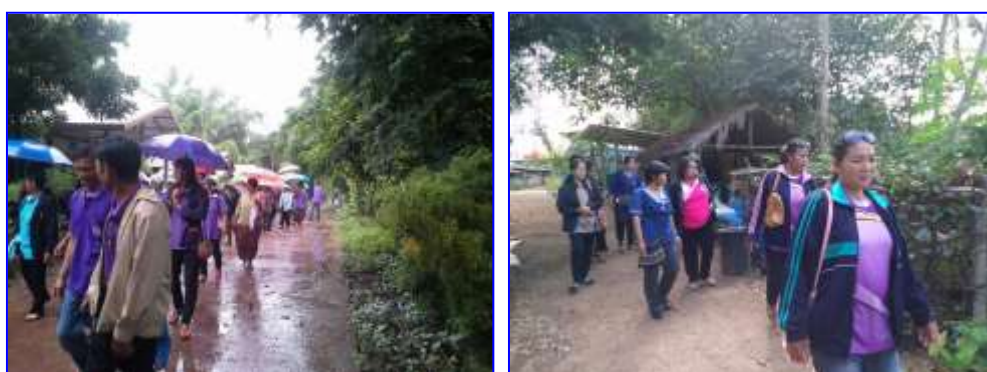
ภาพที่ 22 - 23 กิจกรรมศึกษาดูงาน

สำนักงานเกษตรจังหวัดหนองบัวลำภู กิจกรรมศึกษาดูงานเพื่อสร้างเครือข่ายภายในจังหวัด และแลกเปลี่ยนแนวทางการดำเนินงาน การประกอบอาชีพในชุมชน โดยนำระบบเกษตรที่ให้ความสมดุลของมิติ เศรษฐกิจพอเพียง สังคม และระบบนิเวศ โดยช่วยฟื้นฟูและอนุรักษ์ทรัพยากรและสิ่งแวดล้อมในไร่นา ลดการพึ่งพาปัจจัยการผลิตจากภายนอกให้มากที่สุด ให้สามารถดำรงชีวิตและประกอบอาชีพได้อย่างยั่งยืน